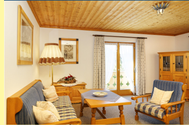
FERIENWOHNUNG NR. 4