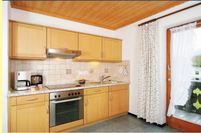
1. STOCK – SÜD- UND OSTBALKON