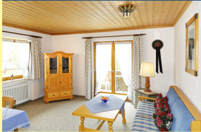
FERIENWOHNUNG NR. 3