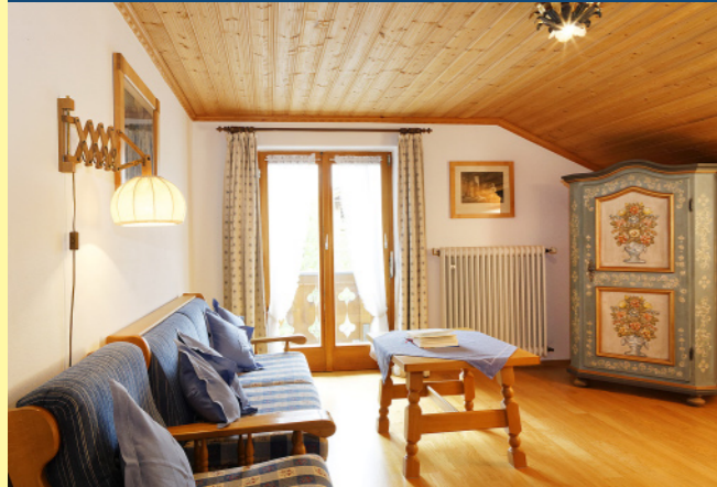
FERIENWOHNUNG NR. 2